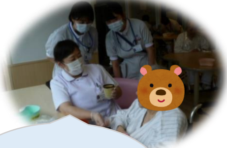
食事介助の ポイント