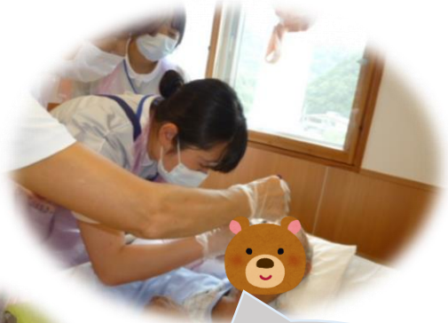
口の中を よく見て みよう！